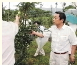
りんご新しい化栽培圃場