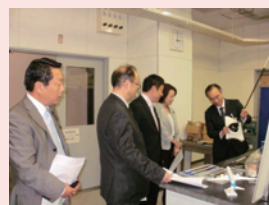
技術センター視察

このほか、議会の運営が円滑に行われるよう日程などを協議する議会運営委員会があります。また、必要がある場合、特定の事件について調査及び審査を行うための特別委員会が設置されます。