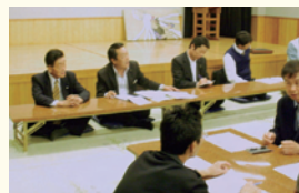
松沢、葛蒲沢の陳情