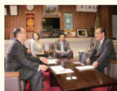
長野県短期大学視察