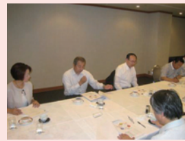
長野県信用保証協会研修会