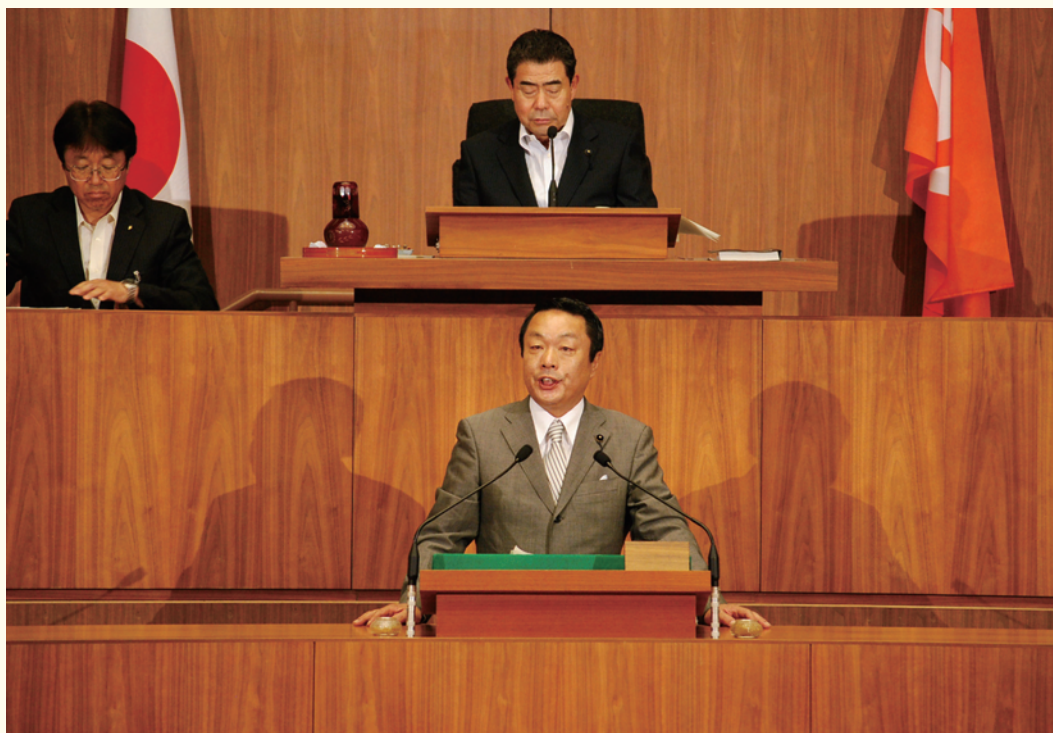
6月定例会一般質問

国への要望額の54%の約6億7千万円に留まった。茅野市、富士見町、(原村は現在要望をとりまとめ中)においても、要望額の1割しか採択されていない。国に増額を要請するとともに、市町村が負