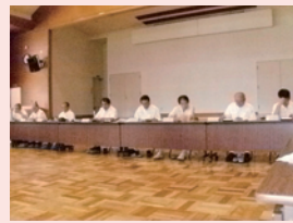
危機管理建設委員会陳情